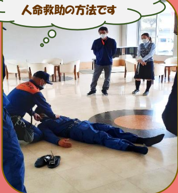
人命救助の方法です