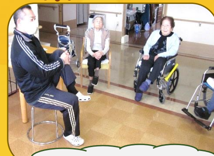
肩がよく上がってますね!