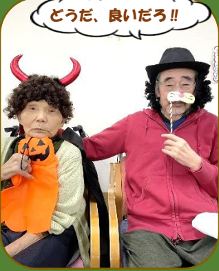
どうだ、良いだろう!!